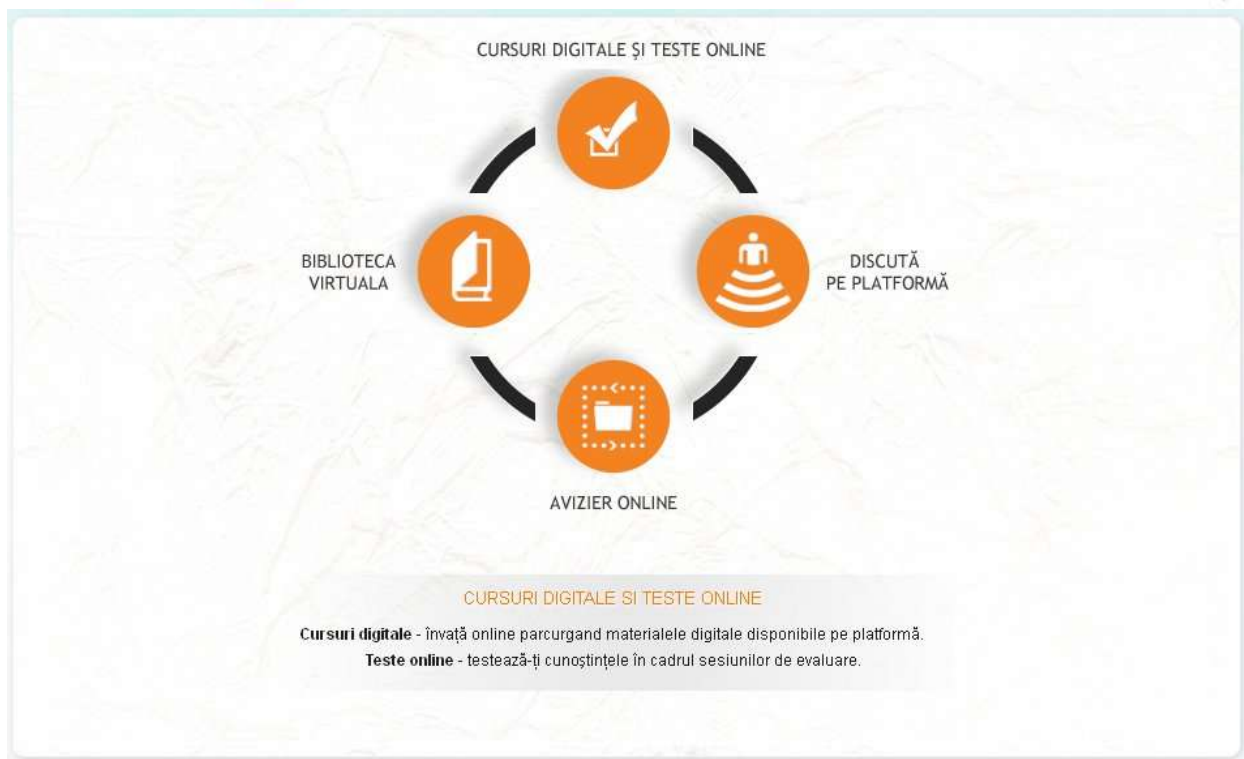
Fig. 8 – Meniu grafic intuitiv

UNIVERSITATEA DE ȘTIINȚE AGRONOMICE ȘI MEDICINĂ VETERINARĂ BUCUREȘTI