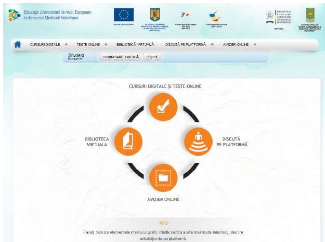
Fig. 2 Prima Pagină – acces autentificat

În continuare, puteți accesa următoarele rubrici: Știri, Calendar, Forum, Mesagerie, Bibliotecă virtuală, Cursuri digitale, Teste online.